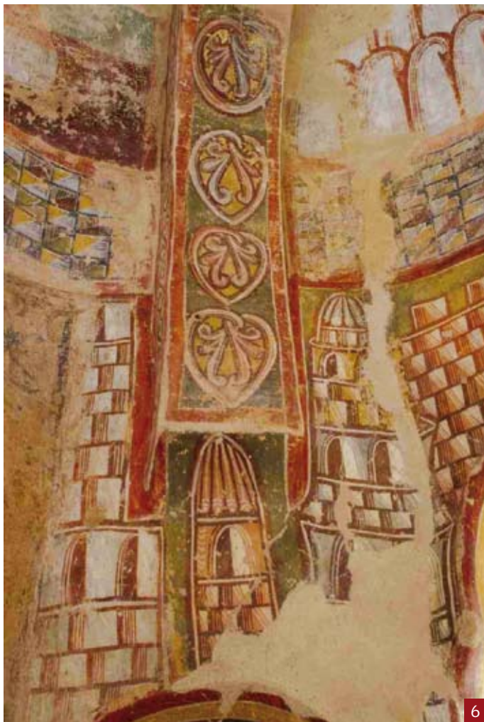
6. Nervios de arco decorados.